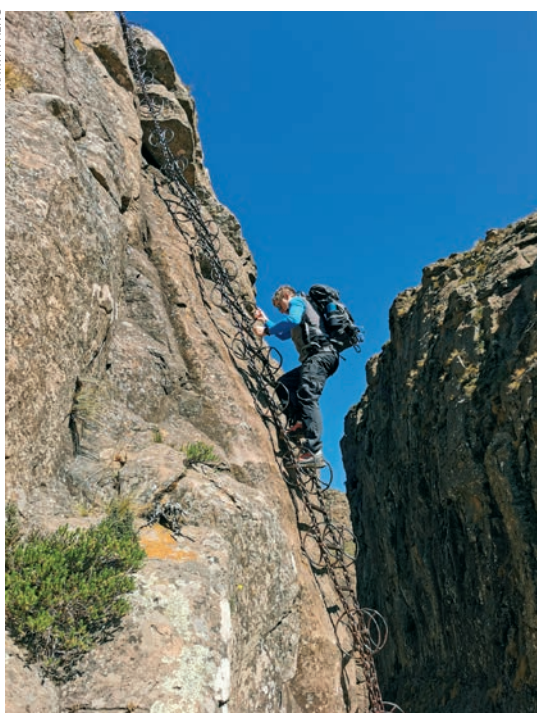
Na lančanim ljestvama

Teško mi je opisati osjećaj dok preko nepregledne visoravni, preko travnate ravnice, prilazimo vertikalnom padu većem od tisuću metara. Nije mi nepoznat osjećaj visokoga grebena, na pamet mi pada greben Triglava ili prostor između Sv. Ilije i Šćirovca na Biokovu, no osjećaj prilaska iz ravnice takvoj vertikali izrazito je intenzivan.