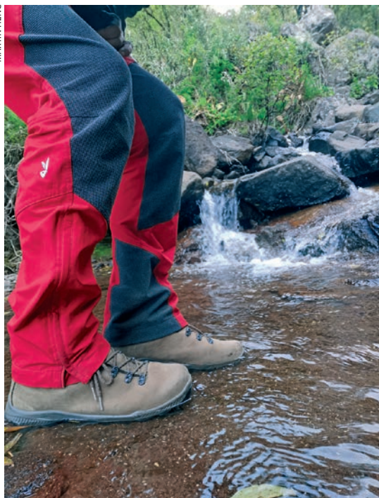
Drakensberg je bogat vodom

sive boje kao i kamen na kojem stoji, pa iz daljine niste sigurni je li i ona dio krajolika. Od gornje stanice valja prijeći cijeli »stol« da bi se došlo do najviše točke, vrha Maclear's Beacon (1086 m).