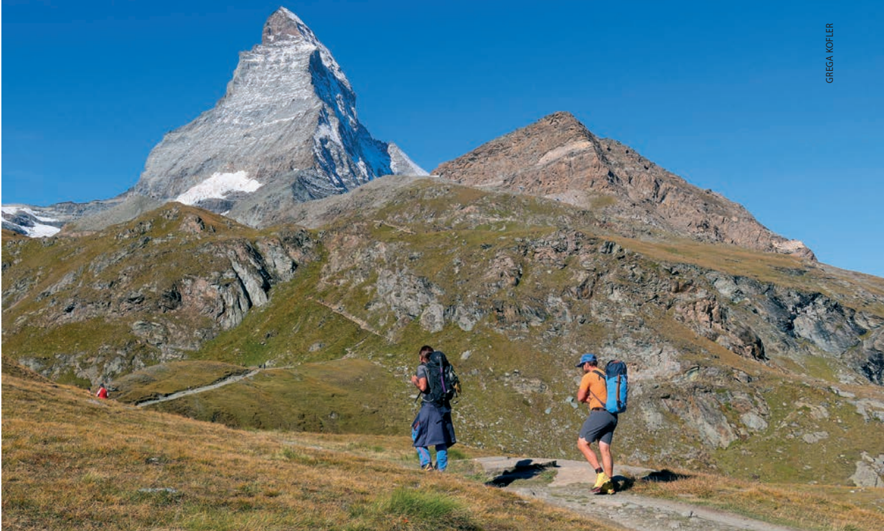
Matterhorn (4478 m)

mekanih livada Zermatta i pitomih švicarskih sela do kojih se može doći žičarom ili pješke. S druge se strane nalazi cijeli masiv Monte Rose s prestižnim vrhovima, poznatim u planinarsko-skijaškom svijetu. Na okupu su Breithorn, Castor i Pollux, Lyskamm, najviši vrh Švicarske Dufourspitze i mnogi drugi, svi na granici Italije i Švicarske, naizgled samo meko uronjeni u vječan snježni prekrivač Peninskih Alpa. Nasuprot njima izdiže se osamljen i gol, stjenovit Matterhorn. Na trenutke mi se činilo kao da je sam protiv svih, drzak i tvrdoglav, i kao takav mami planinare istih osobina ne bi li ih zbacio sa sebe dokazujući da je jači. A ponekad sam ga vidjela kao ukletu planinu koju je jedan davni tektonski potres učinio drugačijom od susjednih, dopustivši afričkoj ploči da nadvisi indoeuropsku i mnogobrojnim ledenjacima koji su se spuštali s vrha i svojom erozijom, i po svojoj želji, oblikovali njezine geometrijskim mjerilom savršene strane.