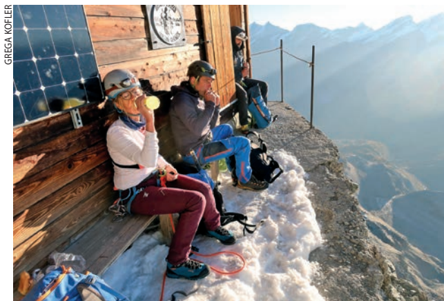
Ispred Solvayhutte (4003 m)

silazak biti brz, okomica se ublažila toliko da se više nije moglo absajlati, ali ni kretati normalnim hodom. Dečki su u tome bili brzi, a ja sam oprezno i polagano gazila unatraske napipavajući mjesto za nogu. Počeli smo shvaćati da nećemo stići na posljednji polazak žičare u dolinu, ali jedino mi je bilo važno spustiti se. Posljednjih je 400 metara trajalo beskonačno. Nisam upamtila da je ta početna dionica ujutro, po mraku, bila toliko dugačka. Grega me je počeo zafrkavati da će zatvoriti kuhinju u Hörnlihütte i da neće biti ni kolača za brzi zalogaj prije večere u Täschu. Zovemo hotel kako bismo javili da ćemo doći kasno, ali doznajemo da nas sobe zbog neke zabune ne čekaju, pa uz svu muku silaska imamo još i problem rezervacije novog hotela. Sve češće zastajemo radi telefonskih poziva, što mi odgovara, jer napokon osjećam žeđ i pijem sve zalihe vode koje sam ponijela. Glad još ne osjećam. Oko 17 sati napokon ugledam onaj posljednji greben koji završava okomicom s »klanfama«. Pomilujem kip svetog Bernarda na ulazu u stijenu, zahvaljujem na pozivnici i predivnom danu koji mi je