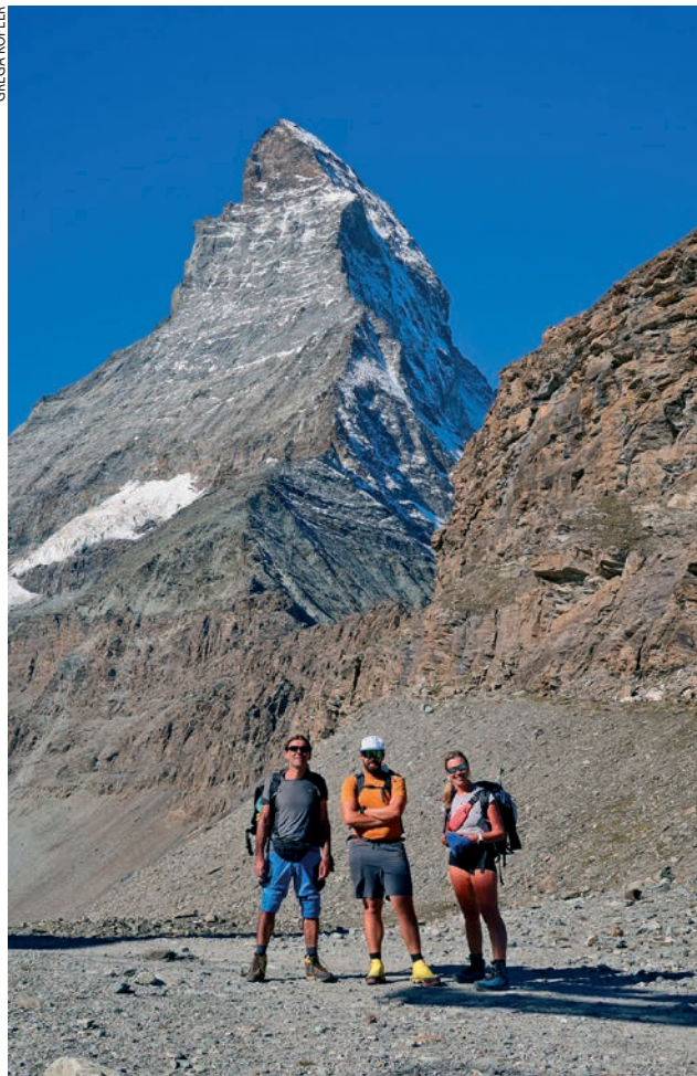
Ulaz u stijenu, Sveti Bernard