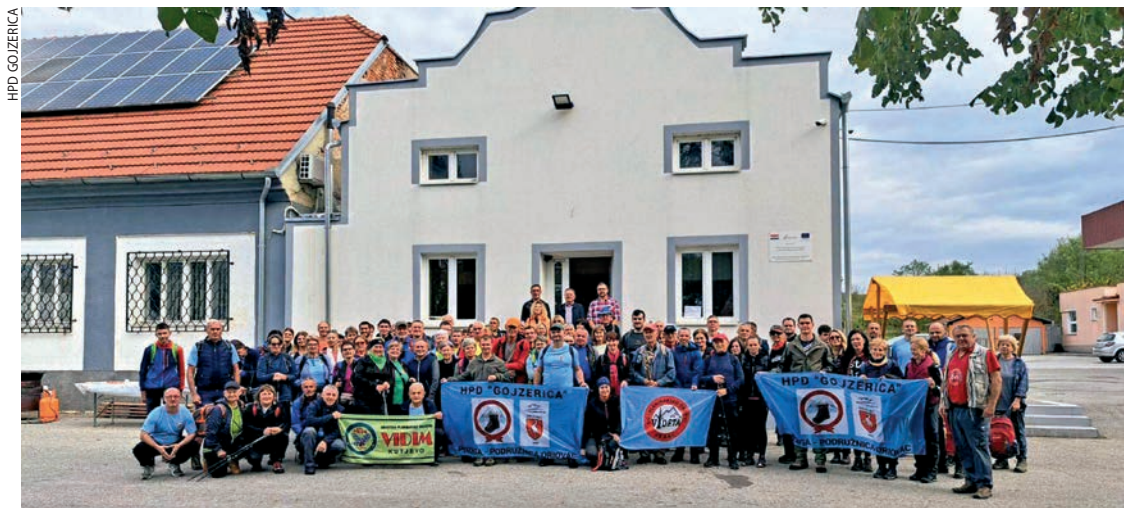
Sudionici 3. Memorijalnog pohoda Od Premužića do Štampara

Nakon pozdrava svi su planinari krenuli prema Kasonjskom vrhu, gdje je završavala kraća staza. Duža se nastavljala prema Brodskom Drenovcu. Oni koji su hodali lakšom stazom vratili su se s Kasonjskog vrha preko Unke u Oriovac, a ostali su nastavili prema