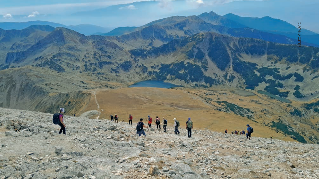
Vidici prilikom silaska s vrha Vihrena

poluotoka te omeđena Dunavom, obalom Crnog mora i planinama, Bugarska se nalazi na prijelazu između Europe i Orijenta. Pod turskom vlašću bila je od 1393. pa sve do 1878. Graniči s Grčkom na jugu, Turskom na jugoistoku, Srbijom na zapadu, Sjevernom Makedonijom na jugozapadu i Rumunjskom na sjeveru. Većina Bugara pripada pravoslavnoj vjeri, a u većem su broju zastupljeni i muslimani i katolici. Bugarska je članica Europske unije od 2007.