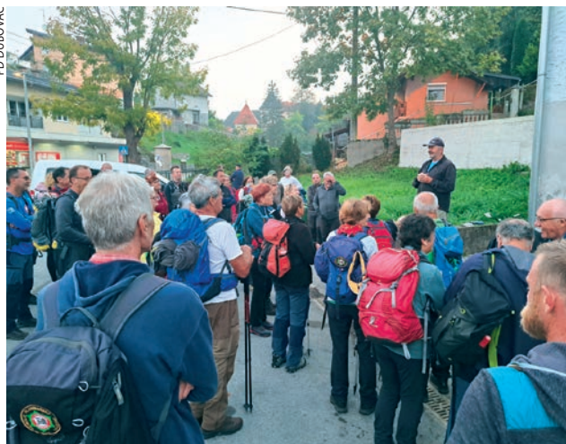
40. obljetnica Dubovačkoga planinarskog puta