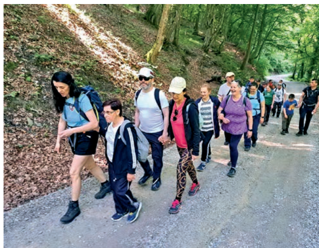
Sa slijepima i slabovidnima na Papuku