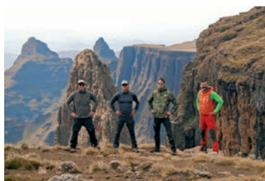
534 Planinarenje u Južnoj Africi