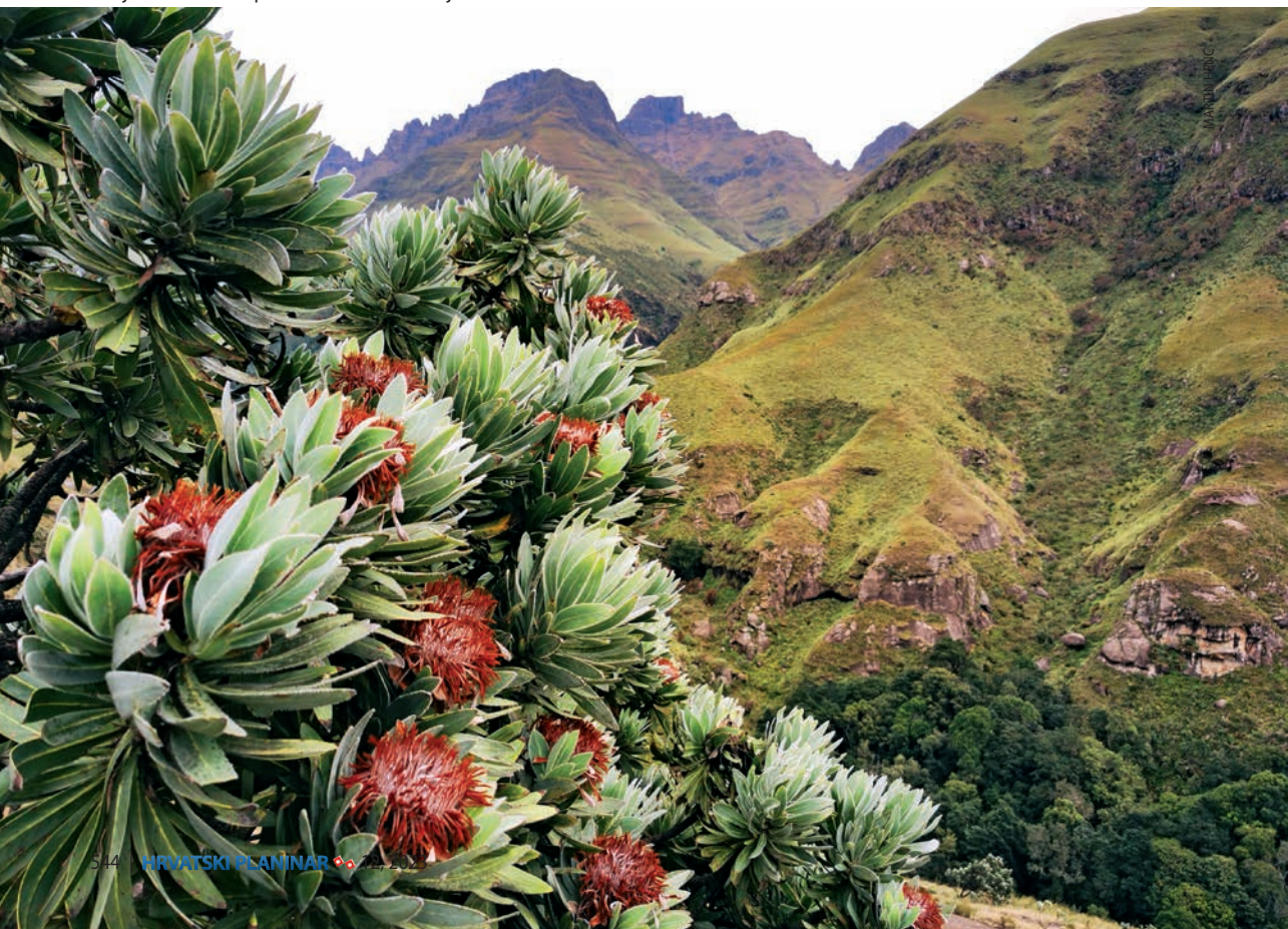
Kraljevska ili velika protea – nacionalni cvijet Južne Afrike

Na mjestu gdje staza Platteklip Gorge izlazi u vršnu zonu, desno se za 10 minuta stiže do žičare, a lijevo za 30 na vrh. Put do Maclear's Beacona vodi sredinom »stola« kroz krajolik kojim dominiraju kamen i nisko raslinje. Mnoštvo je plitkih lokvica,