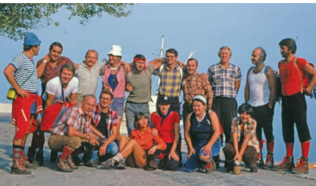
Graditelji Kapelskog planinarskog puta u Klenovici