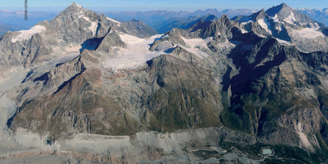
Dent Blanche, Zinalrothorn i Weisshorn

ne počnu bljeskati trenuci saznanja o tome gdje sam bila i što sam učinila.