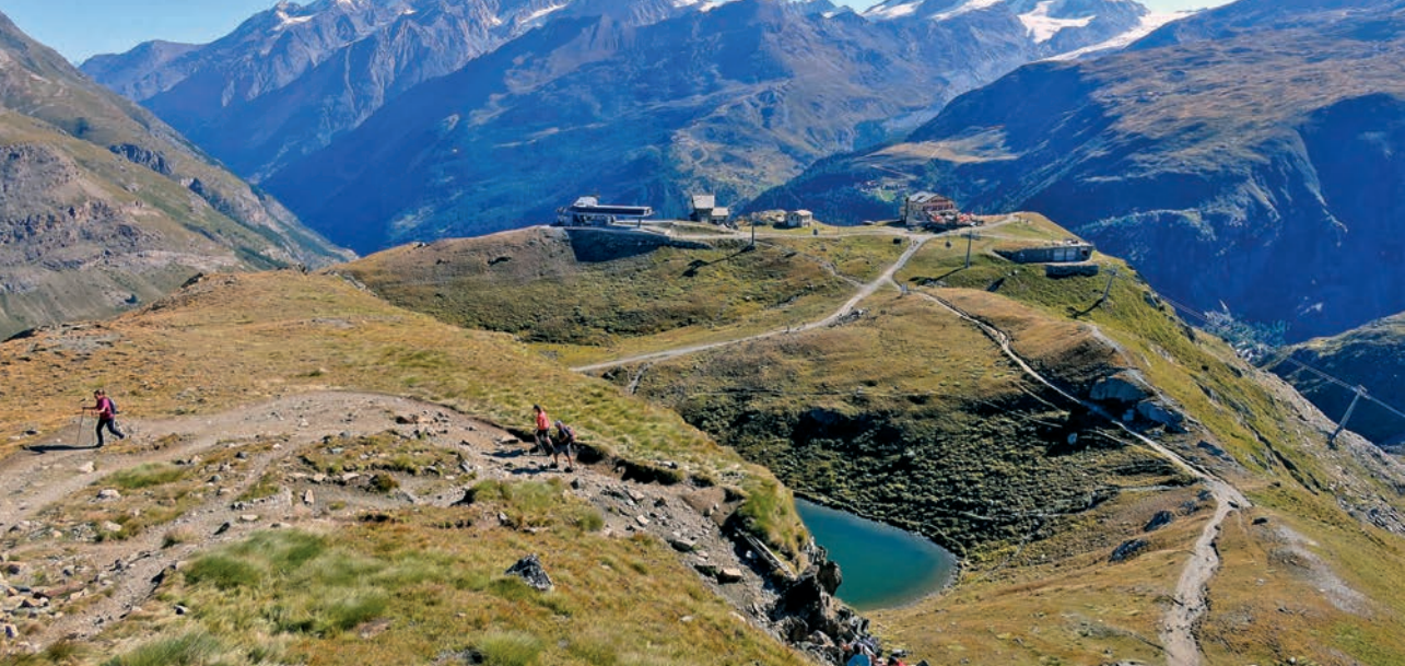
Nadelhorn, Lenspitze, Dom, Taschorn, Alphubel, Rimpfshorn i Strahnhorn

avanturu. Tek večer uoči uspona pročitala sam nekoliko blogova u kojima mladi i jaki penjači tvrde da im je to bio najteži uspon. Ali tada je već bilo kasno da se moje samopouzdanje poljulja i da se vratim neobavljena posla.