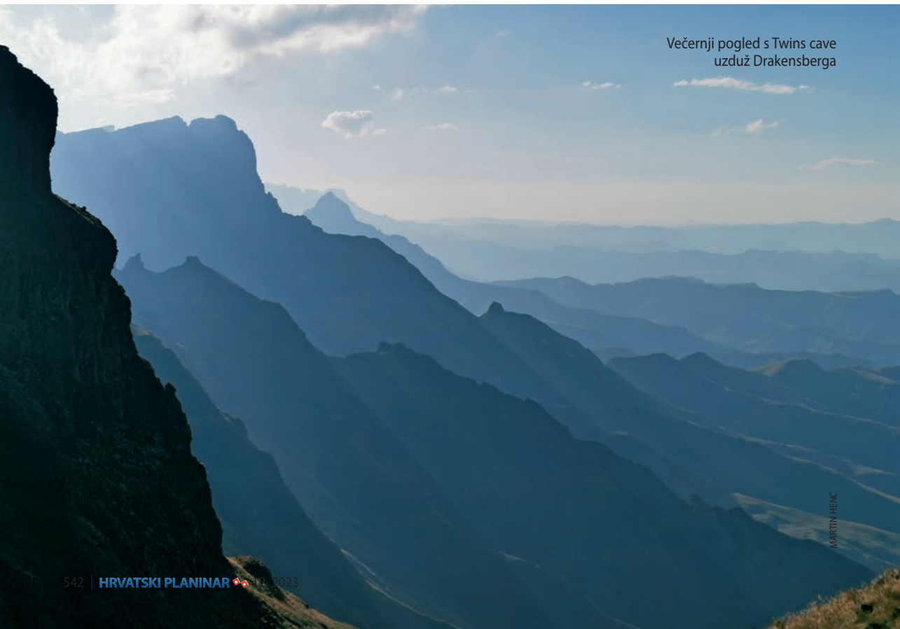
Večernji pogled s Twins cave uzduž Drakensberga

Što se više spuštamo, zavoji su sve kraći. Postupno ulazimo u lijevak koji se na kraju pretvara u korito potoka, odnosno rječice uz koju nas put vodi iz planine. Neko vrijeme, sat-dva, hodamo kroz potok i uz njega. Svako malo neki pritok