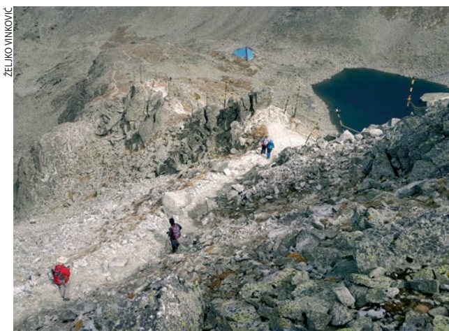
Silazak s Musale

Cijela naša skupina može biti zadovoljna ispenjanim i viđenim u proteklih pet dana, a mlado PD Gea može biti ponosno na organizaciju izleta. Doviđenja Bugarskoj i dragim zagrebačkim prijateljima do nekih novih uspona!