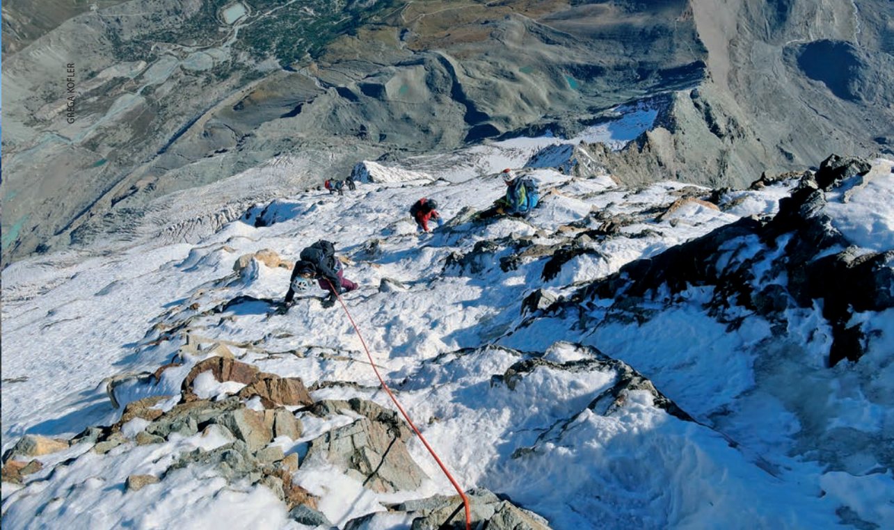
Silazak niz strminu Matterhorna

uspijevam popiti ni čašu tekućine, toliko sam puna. Ne osjećam ni glad ni žeđ, samo želju za kretanjem, da čim prije stignem do kraja, jer mi se čini da se, ako stanem, neću više moći pomaknuti.