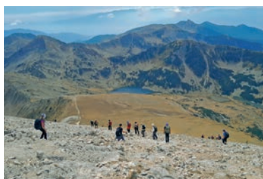
546 U Bugarskoj, na prijelazu između Europe i Orijenta