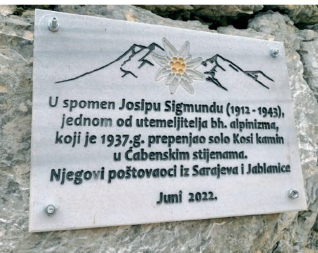
Spomen-ploča Josipu Sigmundu

Dana 23. rujna postavljena je na planini Treskavici spomen-ploča Josipu Sigmundu, jednom od trojice glavnih utemeljitelja alpinizma u Bosni i Hercegovini. Postavljena je ispod Suhe lastve, pored markirane staze koja vodi podno Nikolinih stijena prema Bijelom jezeru, na mjestu odakle se otvara vidik na Čabenske stijene. Idejni začetnici postavljanja ploče bili su istaknuti planinari Braco Babić i Slobodan Žalica, a pomoć u realizaciji akcije pružila je Stanica GSS-a Sarajevo.