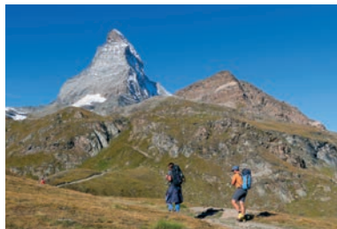
524 Veličanstveni Matterhorn