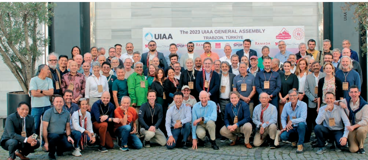
Predstavnici saveza u Skupštini, Izvršni, Upravni odbor i članovi komisija UIAA

Na istoj su sjednici Plaketom Grada Samobora nagrađeni HPD Japetić, koje ove godine obilježava 100.