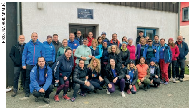
Sudionici seminara za voditelje planinarskih škola u Tuku