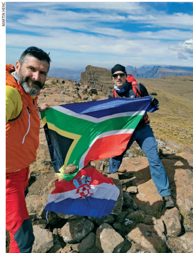
Na bezimenom vrhu (3210 m), najvišoj točki puta

Vrlo brzo nakon prvog prijevoja, spustivši se u travnatu udolinu, prelazimo potok te prvi put kročimo u Lesoto 9 .