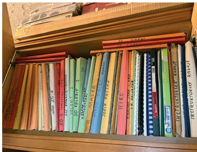
Mali dio speleološke pisane građe Vlade Božića

Najdublje sam bivakirao na dubini od 750 metara u Lukinoj jami, a u Veternici i drugim špiljama mnogo puta, i normalno smo spavali. Uvijek je to bilo spavanje nakon nekakvog napora. Ili smo došli ujutro pa istraživali i onda išli spavati, ili smo trebali doći do špilje pa onda prespavati, uglavnom, uvijek smo išli spavati umorni, tako da smo najčešće svi dobro spavali. Ne sjećam se da sam ikad razmišljao o tome da sam negdje duboko i da mi je nešto čudno. Možda jedino u jami Bezdanjači kod Vrhovina, jer to je jama u kojoj su pronađeni ostaci ljudi koji su ondje živjeli. Bili su to ostaci iz brončanog doba, a ljudi su u toj jami pokapali svoje mrtve. Ondje smo spavali otprilike na stotinjak metara dubine, na mjestima gdje su nekad bili grobovi. Prije nas na tom su mjestu bili arheolozi, koji su pokupili arheološki materijal. Po stranama su bila nešto kao gnijezda i to je bilo baš zgodno za spavanje. Nakon toga smo pričali tko je u kakvom grobu spavao, jer ondje su nekad bile položene ljudske kosti, zajedno s keramikom i brončanim predmetima.