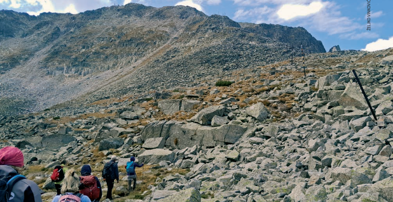
Staza od skloništa Ledeno jezero prema vrhu Musala

je najveće po površini, a ostala tri su Bubreg, Trilistnika i najniže, Donje jezero.