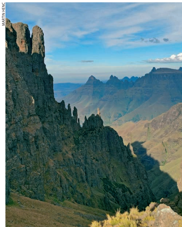
Madonna and her worshippers

nalazi se prirodni bazen veličine 15 × 5 metara, koji pune dva glavna toka rijeke. Kupanje, plivanje i osvježanje u ledenim izvorima rijeke Oranje na visini od 3000 metara, daleko u planinama u Lesotu, neprocjenjiv je i neponovljiv doživljaj. Pamtit ću to do kraja života!