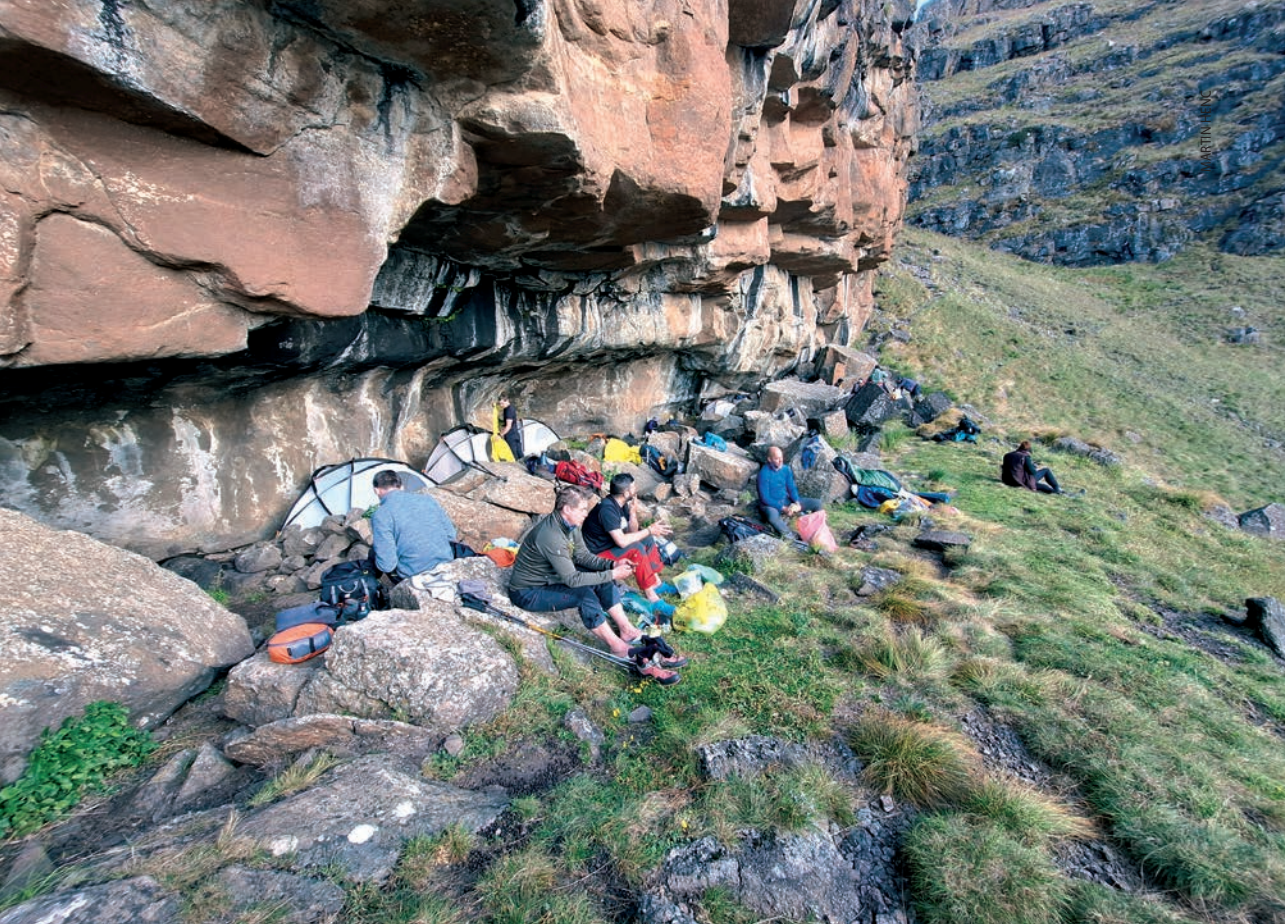
Zadnji logor na Drakensbergu - Twins cave

kompleks s brojnim većim i manjim bungalovima. Oduševljavaju nas njegovana zelena trava, cvijeće, bilje, drveće. Nekoliko antilopa slobodno šeta uokolo. Tu su i ptice raznih boja.